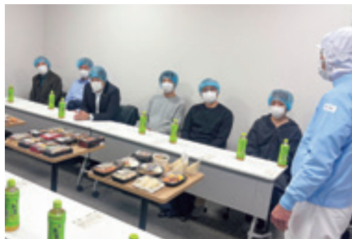
意見交換を行う担当者と会員

JA山形おきたま稲作振興会は12月11、12日の2日間で視察研修を実施し、会員9名が参加しました。 研修では神奈川県のアリーフーズ株式会社横須賀工場を訪問し、精米から製品化するまでの加工工程や品質管理体制を間近で確認し理解を深めました。