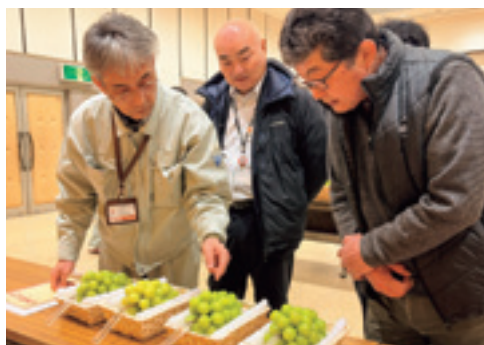
出品されたシャインマスカットを確認する審査員

JA大粒ぶどう振興部会は12月25日、南陽支店で冬季シャインマスカット品評会を開きました。貯蔵品シャインマスカットを対象とした品評会は当JA及び山形県としても初の取り組みで、冬に出荷される貯蔵品は品質が価格を大きく左右することから、品質の高位平準化とおきたま産シャインマスカットのブランド価値向上に繋げることが狙いです。