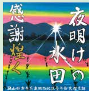
《川西地区青年部 大塚支部》