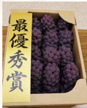
デラウェア品評会

最後に、農政の大きな転換点を迎える中、農産物の価値を未来へつなぐた めには、「国消国産」の理念を地域か ら支え続けることが何より重要であり ます。現場の実情を国・県への確に届 け、「良い品物は高く売る」を基本に、 生産基盤の強化と農家手取りの確保に 向けた取り組みをさらに進めてまいり ます。