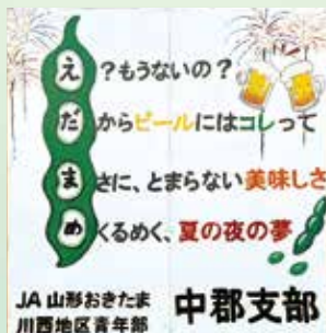
《川西地区青年部 中郡支部》