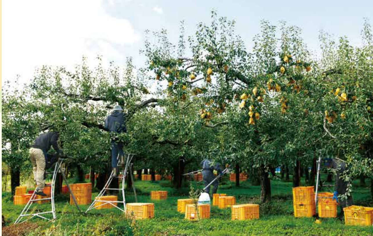
ラ・フランスの収穫期は短く、できるだけ多くの人手が必要