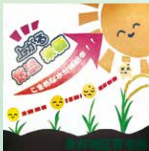
《長井地区青年部 中央班》