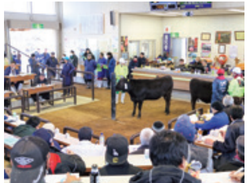
活発な取引となった市場

置賜家畜市場で3月6日、令和7年度最後の子牛のせりが行われ、県内外から多くの購買者が来場しました。 雌牛は82頭、去勢牛は121頭が取引され、雌と去勢を合わせた平均価格は79万4921円（前回対比109%）、売上金額は1億6136万8900円（同103%）で取引されました。 今回の市場は、前回と比較すると頭数はやや少なかったものの、全国的に肥育素牛が不足している影響もある中、上場された子牛は発育が良く、肉質面に期待される種雄牛が多かったため、活発な取引となりました。 なお、平均単価は前年同時期と比べて約18万円上回る結果となりました。