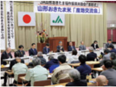
会員卸との意見交換会の様子

JAとJA稲作振興会は3月3日、本店で「山形おきたま米」産地交流会を開催しました。主要米取引卸で組織する米穀事業山形おきたま会会員卸を産地に招き、消費地動向や「山形おきたま米」の評価等の情報共有を行いました。 産地交流会では、会員卸との意見交換会が行われ、主要卸3社から米の需給や価格動向が報告されました。6年産の端境期での米不足を背景に高値で取引が開始されたものの、その後の市況悪化や外国産米増加等で在庫圧縮に苦しみ現状が共有され、家庭用米は高値で販売減、外国産米の定着も進む現状に危機感が示されました。 今後は再投資可能な価格の維持や、国内市場を優先しつつも輸出・加工用など多様なグレードを含めた販売戦略が重要とし、生産者と卸、JAが一体となって「選ばれる産地づくり」に向けて取り組むことを確認しました。