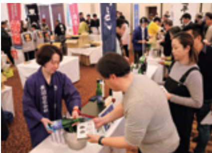
試飲ブースに並ぶ参加者

JAと県、置賜の3市5町で組織される「おきたま食のモデル地域実行協議会」は3月7日、置賜農業振興協議会と連携し、ブランドホクヨウで「第10回おきたま地酒サミット」を開き、県内外から200人以上が参加しました。 会場では管内14酒蔵の試飲ブースが設けられ、自慢の地酒が振る舞われたほか、米沢牛サーロインのステーキや山形の郷土料理「芋煮」などの特別メニューが提供され、参加者は地酒とともに置賜産食材を使用した料理を堪能しました。 また、ステージでは各酒蔵の担当者が自慢の逸品を披露し、酒造りへのこだわりと味わって欲しいポイントなどをPRしたほか、「やまがた舞子」による舞踊と山形大雪花笠サークル「四面楚歌」が花笠踊りのパフォーマンスを行いました。