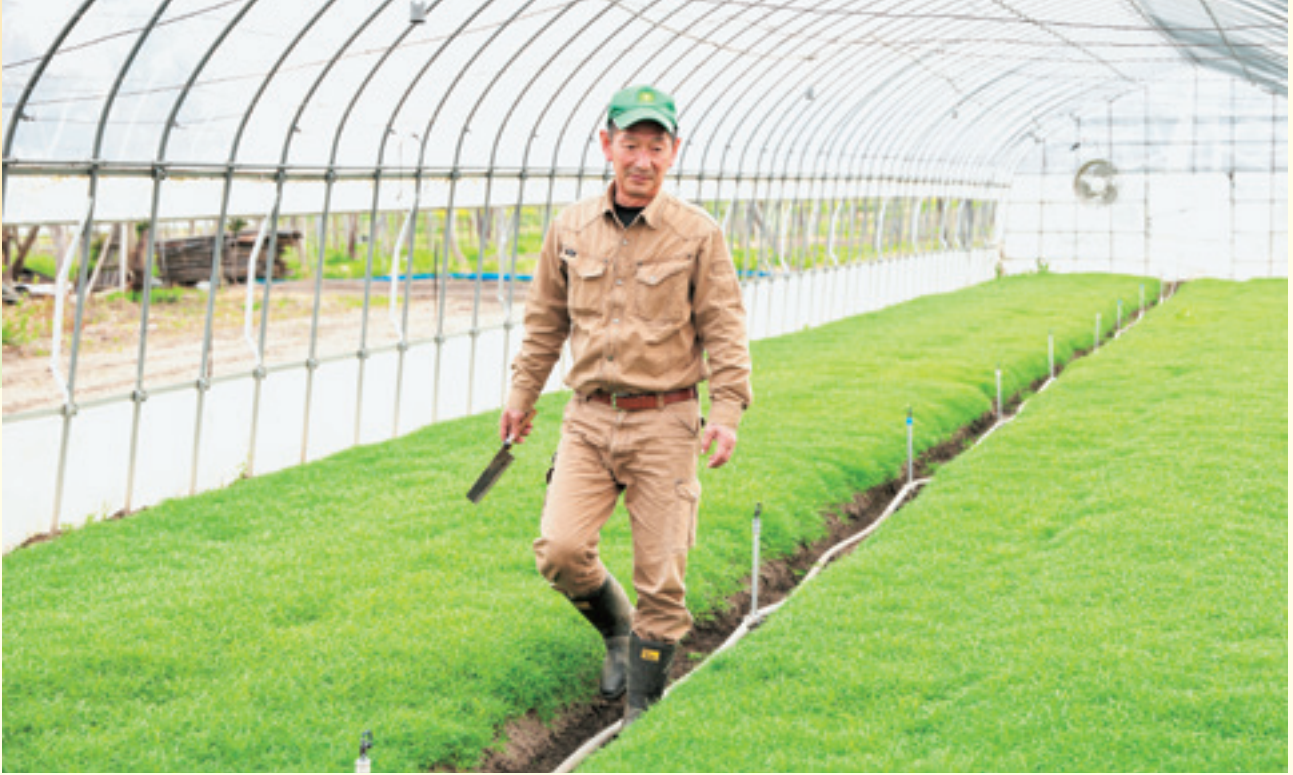
ハウス内の温度や湿度、土の状態などに目を光らせます